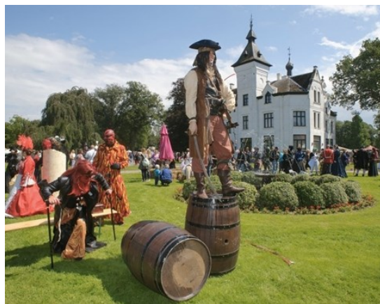
Ijsjes van Wilhelmus

We zijn naar verschillende speeltuinen geweest, hebben muziek gemaakt op het Vrouwenhof, pannenkoeken gegeten en naar het Fantasyval in Wouwse Plantage geweest. Tenslotte hebben we ook nog gezwommen en Glow-in-the-dark-golf gespeeld. Kortom een geweldige zomer.