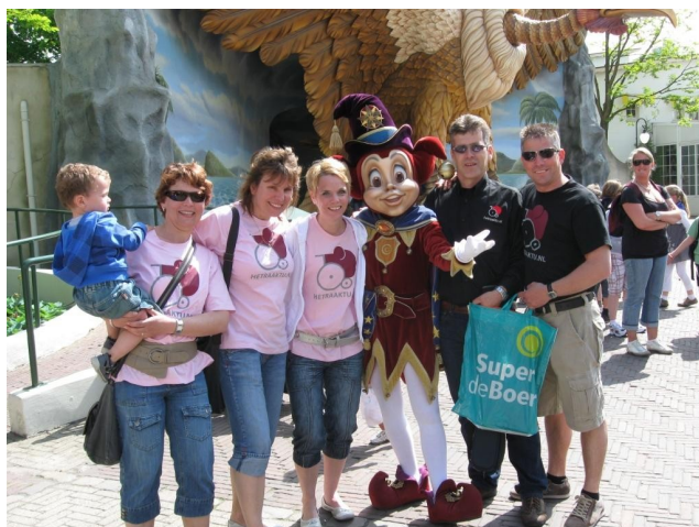
Net als Pardoos hopen we hem volgend jaar wederom te kunnen begroeten!