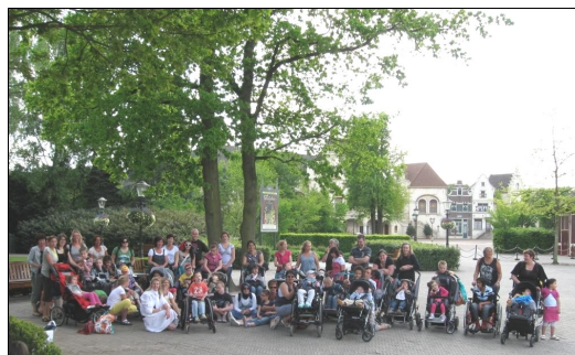
Ook namens alle kinderen bedankt!