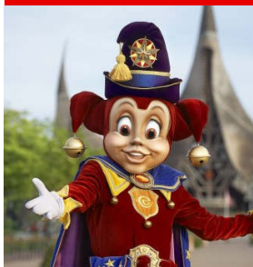
Pardoos verwelkomde de stichting

Hierbij willen wij nogmaals iedereen bedanken welke een bijdrage heeft geleverd aan deze sprookjesachtige dag