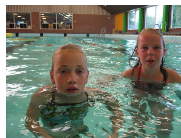
Pret in het zwembad

We hopen dat deze dag zeker zo succesvol zal worden als het ski-evenement van goede vrijdag. Voor meer informatie kunt u terecht op onze website www.hetraaktu.nl