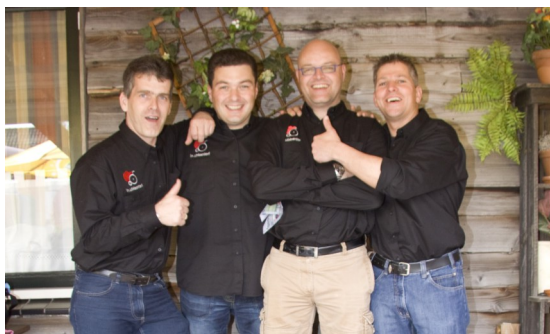
Het bestuur: v.l.n.r.

We hopen dat we in de komende periode weer een beroep op u mogen doen om de kinderen te kunnen blijven trakteren op geweldige evenementen!